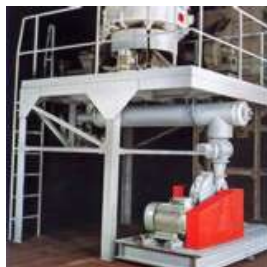
Стандартная система криогенного измельчения полиамидов