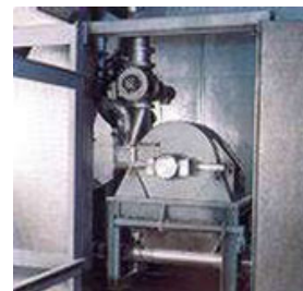
Система криогенного измельчения порошковых покрытий с молотковой мельницей