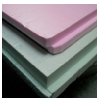
Листы экструдированного пенополистирола